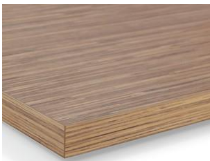
Orlas Imitação Madeira