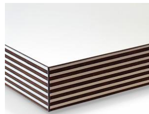
Orlas Imitação Madeira 3D