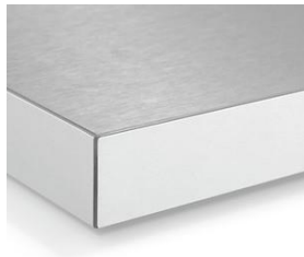
Orlas MAGIC 3