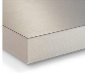
Orlas 3 D